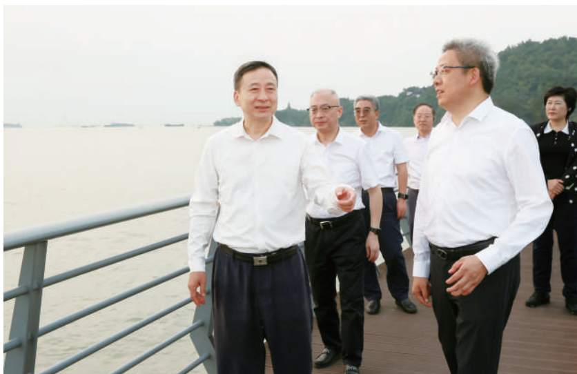
◎ 2023年9月18日至19日,省人大常委会在南通召开全省各级人大代表“牢记嘱托、感恩奋进”学习实践活动推进会,省人大常委会常务副主任、党组书记樊金龙出席会议,与会人员实地考察。

方案,围绕科技自立自强、构建新发展格局、推进农业现代化、强化基层治理、提升民生保障水平、全面加强太湖治理、推进全面从严治党加强“四个机关”建设等7个方面专题,从常委会领导班子、人大专委会、省人大代表三个层面作出调研安排。调研组成员扑下身子、沉到一线,足迹覆盖13个设区市,掌握第一手情况,摸清一线实情,找准发展所需、改革所急、基层所盼的问题,形成系列调研报告并开展成果交流,为省委决策提供参考。