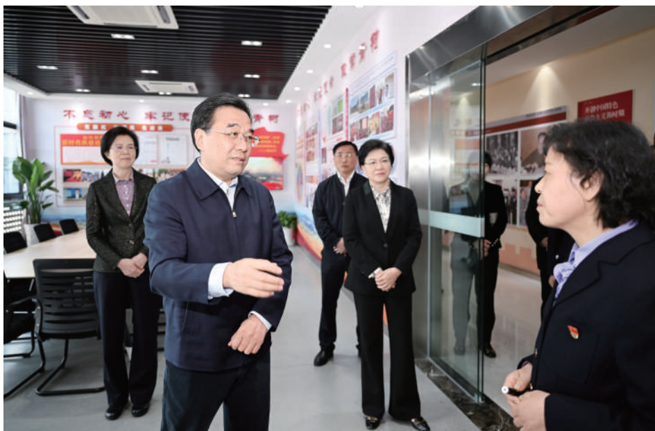
◎ 2023年4月11日,省委书记、省人大常委会主任信长星深入南京的长江岸线、企业、街道、乡村,围绕开展学习贯彻习近平新时代中国特色社会主义思想主题教育进行督导并调研。

2023年4月28日,省人大常委会会议厅里一场理论大学习、思想大武装深入开展——省人大常委会举办人大代表讲坛首场专题报告会暨机关党组、分党组主题教育读书班开班式。省人大常委会常务副主任、