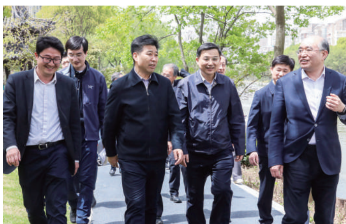
◎ 2023年4月10日至13日,省人大常委会副主任曲福田率执法检查组就《江苏省太湖水污染防治条例》贯彻实施情况开展执法检查。

执法检查也马不停蹄地开展。省人大常委会依据上位法最新要求,以实际工作中遇到的突出问题为导向,与时俱进,修订完善《江苏省水库管理条例》《江苏省湿地保护条例》等地方性法规,最大限度确保法律法规之间的合理衔接,用心呵护“水韵江苏”之美,助力全省交出蕴含碧水绿地新成色的“生态答卷”。