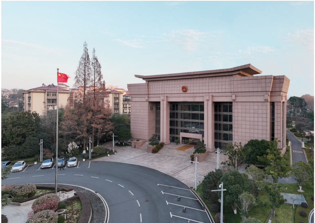
● 省人大常委会机关大楼