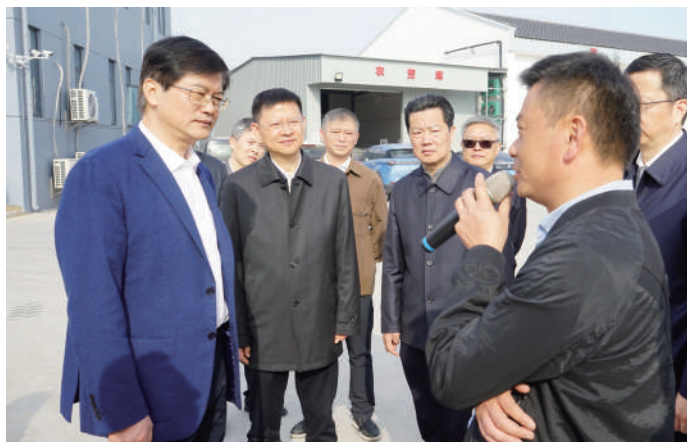
◎ 2023年3月7日,省人大常委会副主任魏国强带队赴苏州常熟,开展《江苏省家庭农场促进条例》立法调研。

太湖边,远山如黛,近水含烟,水天交织处鸟飞鱼跃;在盐城湿地公园,野生候鸟挤在湖面上嬉戏打闹,与蓝天、白云、芦苇共同组成一道美景;泛舟古运河上,欣赏着两岸美景,耳边传来悠扬的扬州小调……江苏之美在于水,“水韵江苏”素享盛誉,“鱼米之乡”自古闻名。